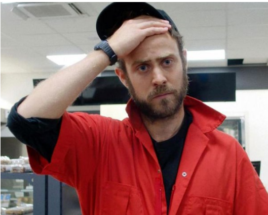
L'employé de la station service:

La mère de Martha (imagine sa description):